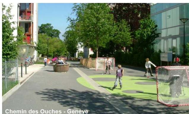
Chemin des Ouches - Genève