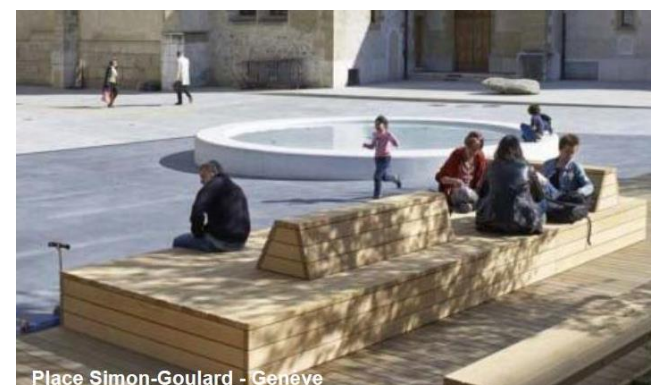
Place Simon-Goulard - Genève