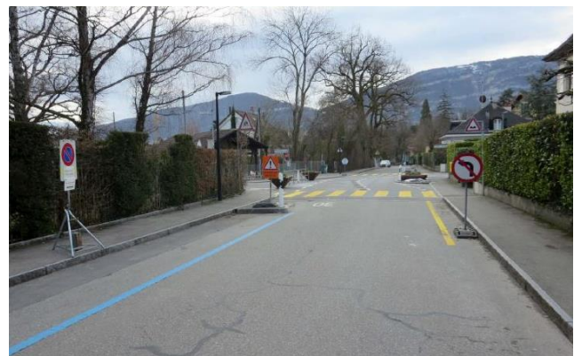
Illustration des mesures provisoires