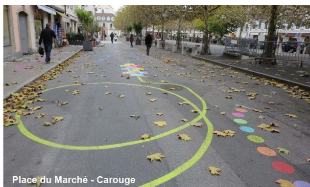
Place du Marché - Carouge

Différents exemples d'aménagements de zone piétonne ont servi pour la conception de cette zone sur le chemin de Colombes. Voici quelques photos d'illustration.