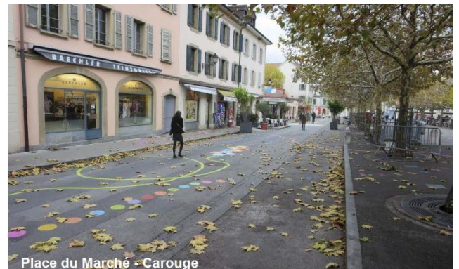
Place du Marché - Carouge