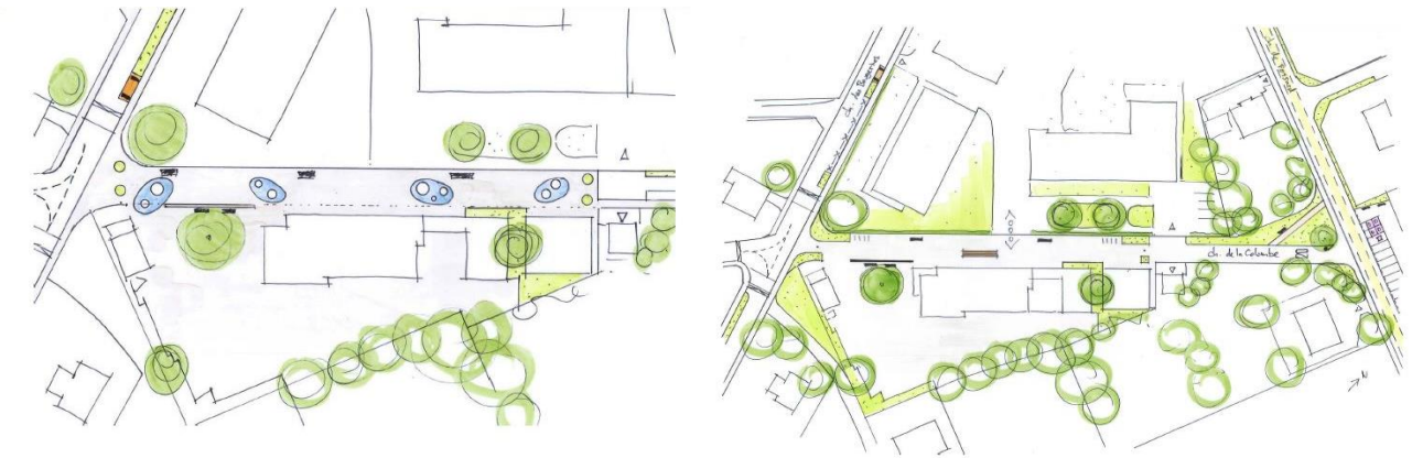
Différentes propositions d'aménagement

L'idée principale était de faire que les habitants s'approprient cette rue. Une transition a donc été pensé avec des zones 20 et 30 aux alentours.