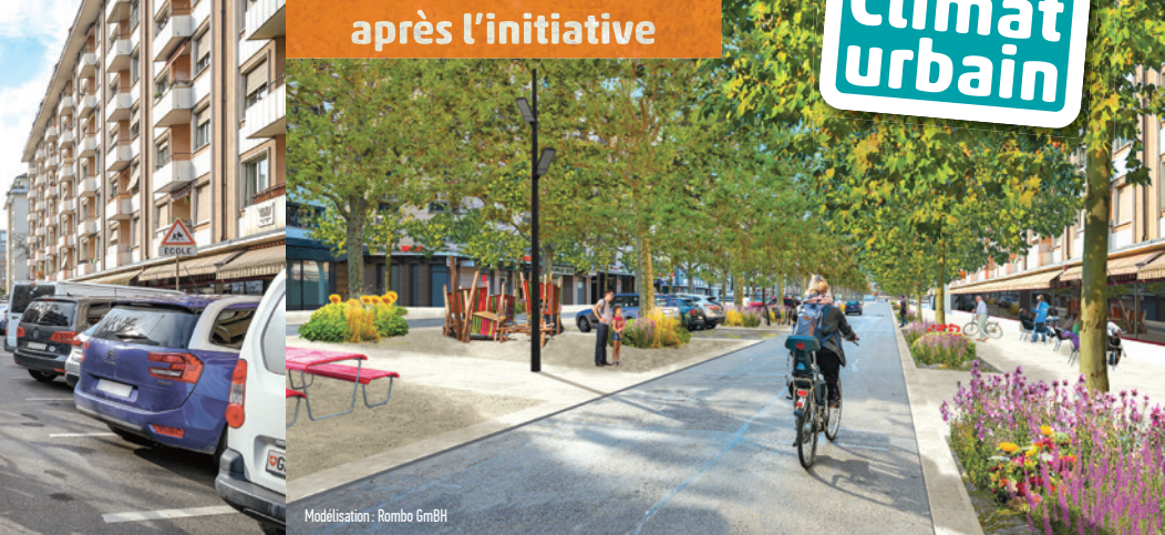
Modélisation : Rombo GmbH

À cause de l'effet « îlot de chaleur », Genève sera l'une des zones urbaines du monde où le changement climatique se fera particulièrement ressentir.